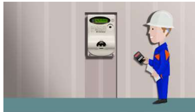
Rilevazione del dato di lettura (*)