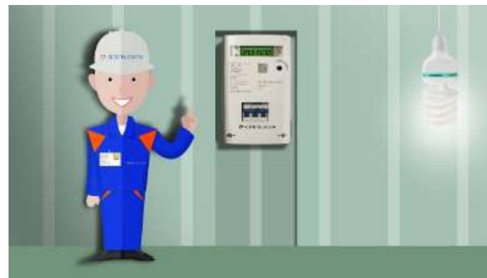
Installazione del nuovo Contatore

(*) tutti i flussi informativi sono automatizzati con registrazione digitale delle letture