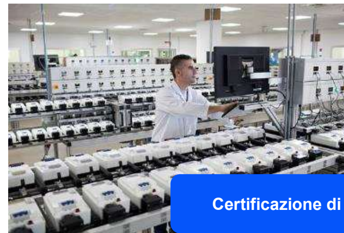
Certificazione di qualità