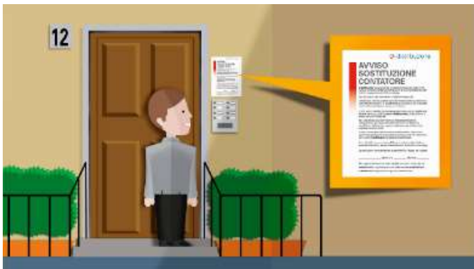
Avviso 5 giorni prima